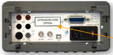
Внешний вид задней панели (B7-78/1)

Интерфейс GPIB (КОП) или RS-232, 10 кан./ 20 кан. сканер для B7-78/1